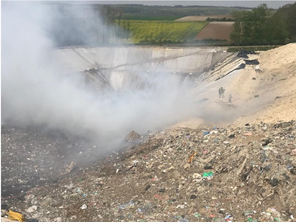
Photographie côté quai de déchargement – 11h50

12H00 : arrivée des engins de TP pour accélérer le transport des terres. 2 tracto-bennes + 2 tombereaux.