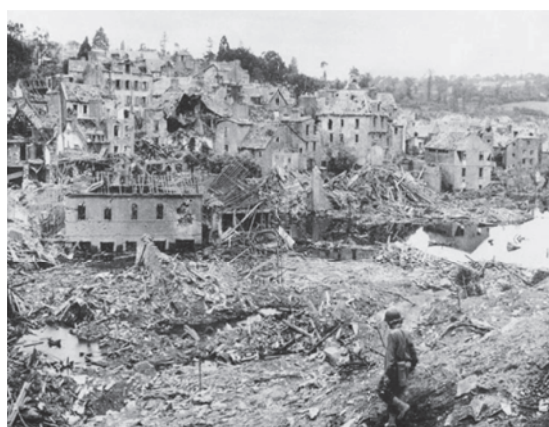
Saint-Lô à la fin juillet 1944

La Sécurité civile, par le biais du Centre Interdépartemental de Déminage (CID) basé à Caen, intervient pour tout enlèvement terrestre des engins de guerre dans les départements de la Manche, du Calvados, de l'Orne, de la Seine-Maritime et de l'Eure. Son champ d'intervention inclut les ports et les plans d'eau.