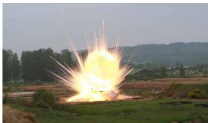
Destruction de roquettes anglaises anti-char