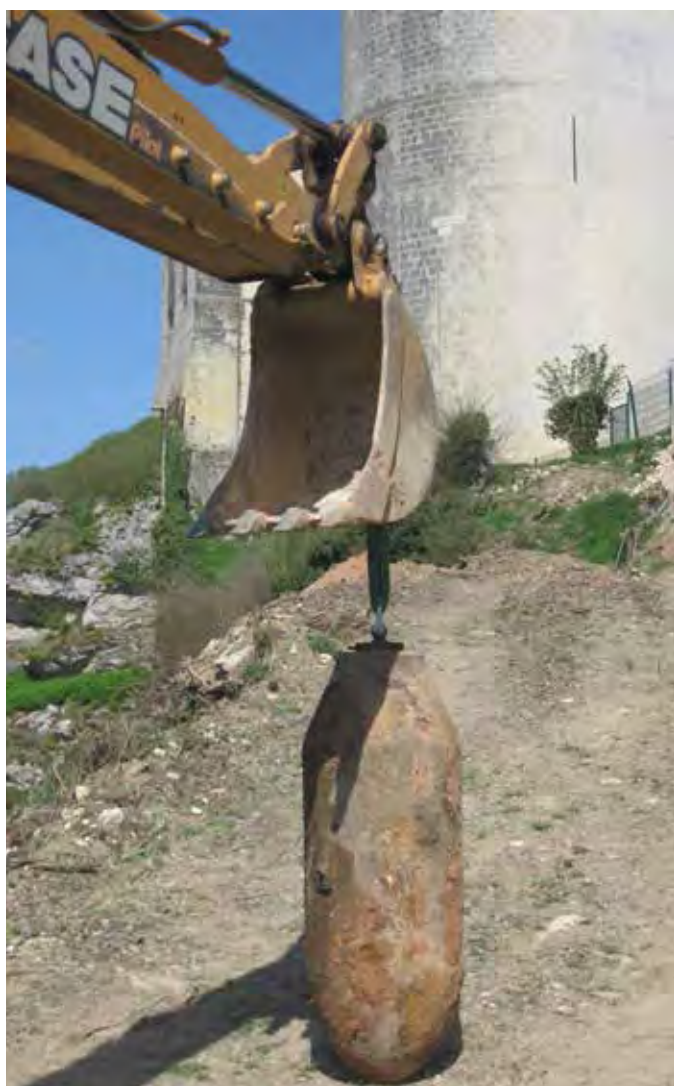
Bombe découverte à Falaise en 2012

UN ENGIN DE GUERRE, MÊME DÉTÉRIORÉ, PEUT TOUJOURS SE RÉVÉLER DANGEREUX.