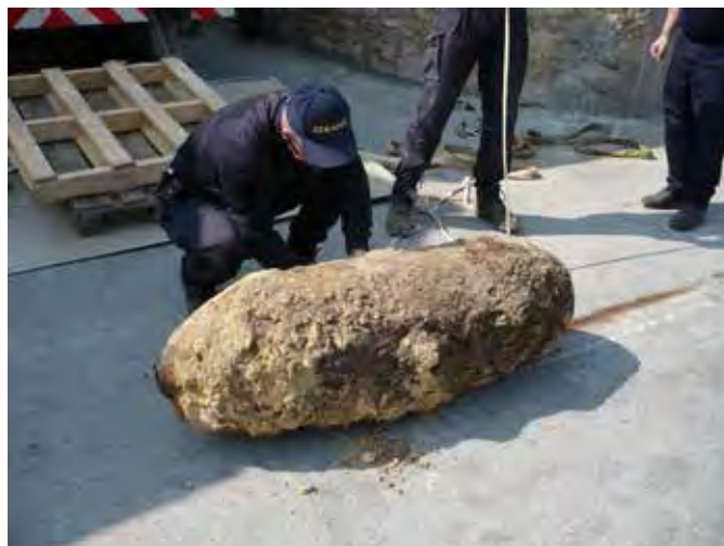
Bombe anglaise de 1000 livres à Fleury-sur-Orne en 2011

Aujourd'hui, le Calvados porte encore les traces de ce conflit et les découvertes de munitions de guerre, souvent encore actives, sont fréquentes.