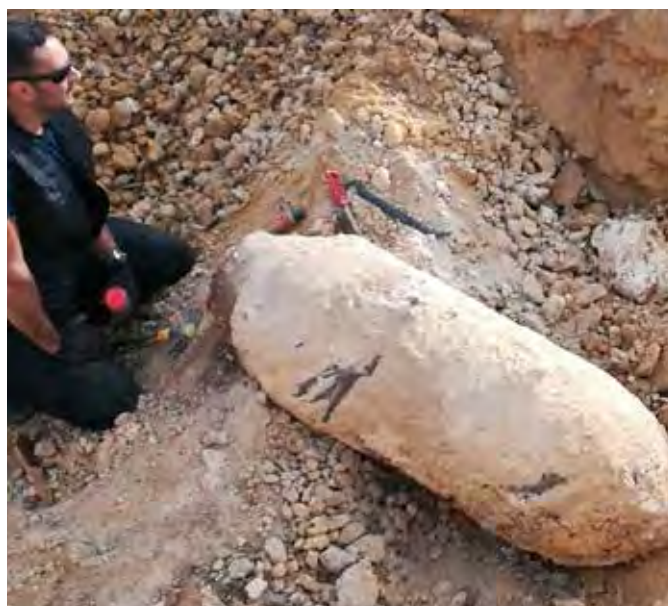
Bombe américaine de 1000 livres à Colombelles en 2020